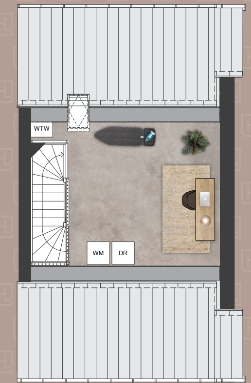
Tweede verdieping bwnrs. 03 en 04